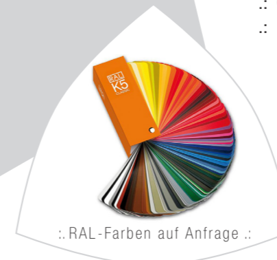
.: RAL-Farben auf Anfrage .: